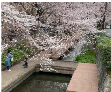
岸辺に桜咲く二ヶ領用水

「二ヶ領用水」とは、江戸時代初期に開削された農業用水路です。川崎市の多摩川に沿った広いエリアに水を引き込み、稲作や地域住民の生活の水を供給してきました。現在では水辺の自然と景観を楽しむ環境用水として人々に親しまれています。桜やさまざまな花が咲き始める季節、春の気配を味わいながら、水の恩恵を得るために、先人たちが注いだ知恵と努力の跡を見ながら歩いてみましょう。