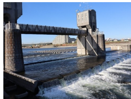
用水への取水口 宿河原の堰