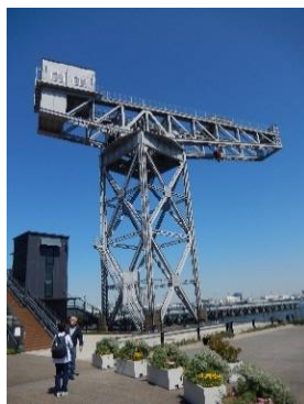
ハンマーヘッドクレーン