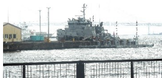
瑞穂橋（ノースドック）

横浜開港から160年余り、全国二番目の都市に発展した横浜市の東部ベイエリアを巡り、開港からの街づくりと歴史の一端を見て歩きます。