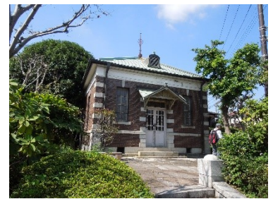
(西谷浄水場旧計量器室跡)