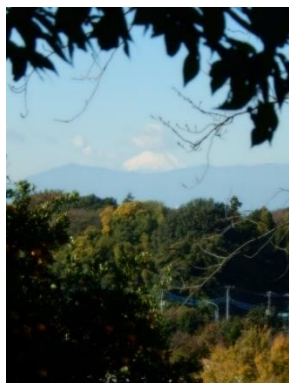
新田丘陵公園から