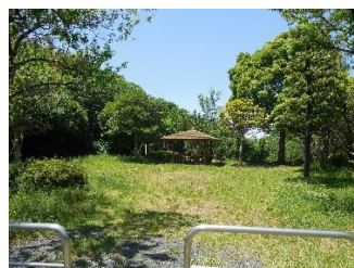
綱島市民の森桃の里