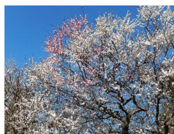
大倉山公園梅(思いのまま)