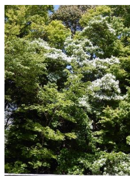
新横浜公園一ッ葉タゴ