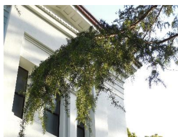
大倉山記念館ヒマラヤ杉

☆第4回 令和5年2月28日(火) 大倉山の歴史と梅の散策へ 約3.8km 2月募集