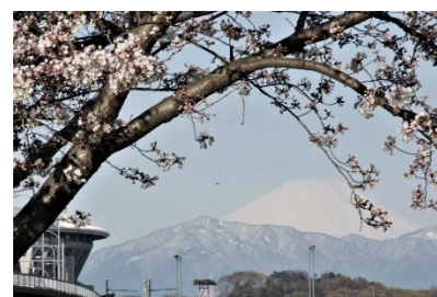
新横浜駅前公園から