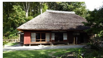
藤本家(馬場花木園内の古民家)